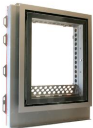
Hochformat z.B.: schwarze Optik