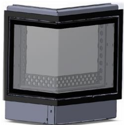
Eckformat z.B.: schwarze Optik