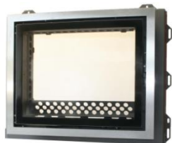
Querformat z.B.: Edelstahl Optik